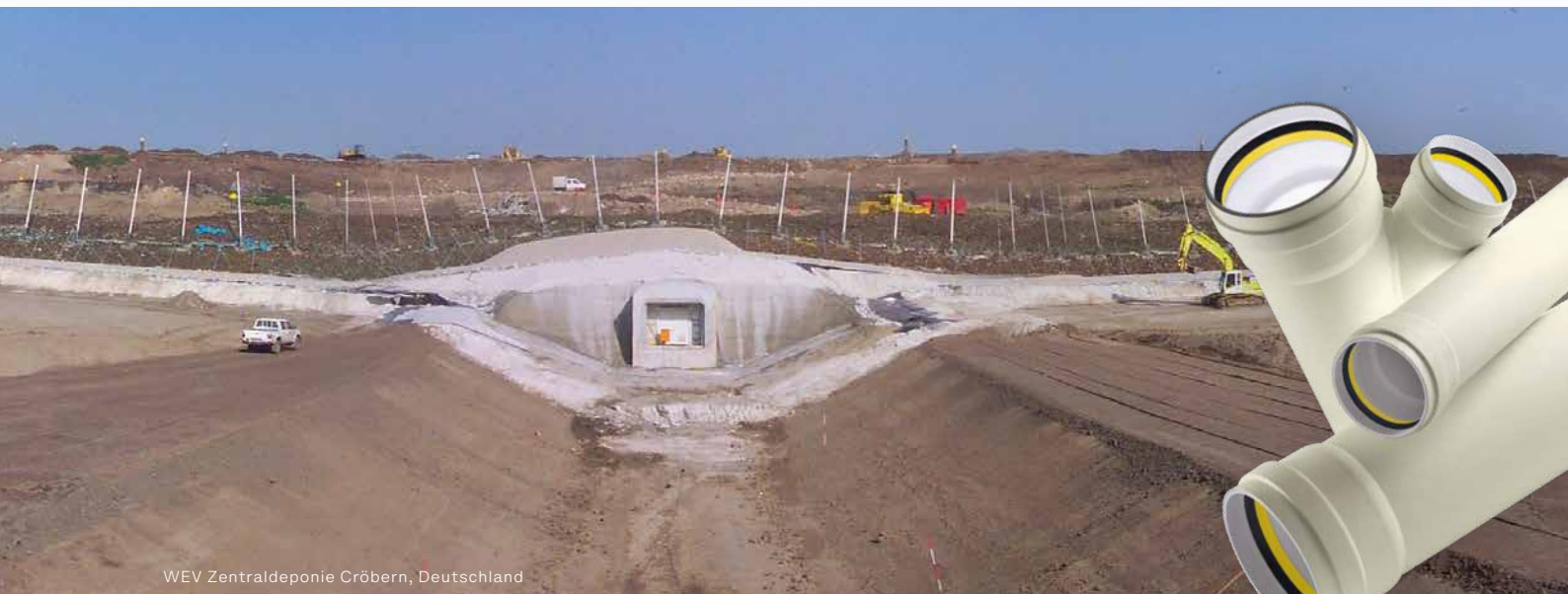
WEV Zentraldeponie Cröbern, Deutschland